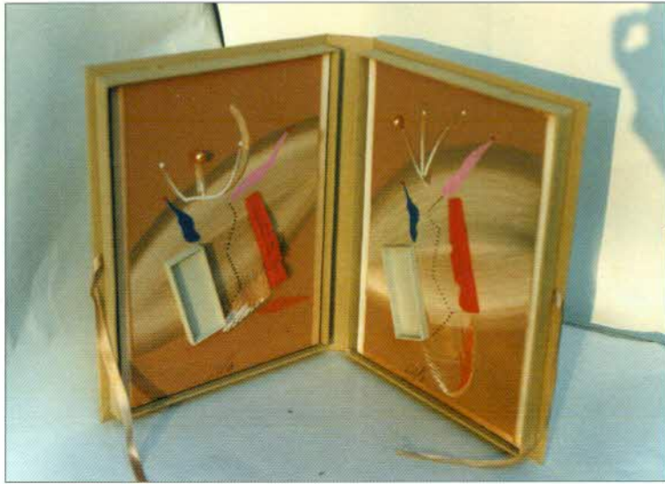
Sergio Dangelo Senza titolo cm 26x20x3 – 1993 contenitore in forma di libro – pagine con collage e pittura